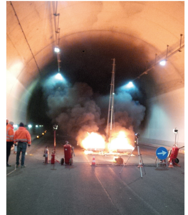
Prova antincendio in galleria Manganaccia